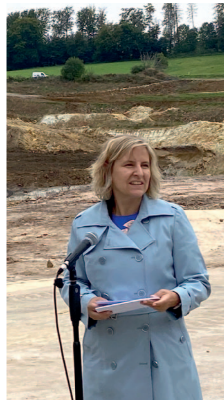
Ministerin Eder hob die Bedeutung des Artenschutzes hervor (Foto: BKRI).

Katrin Eder, Ministerin für Klimaschutz, Umwelt, Energie und Mobilität des Landes Rheinland-Pfalz, lobte den Einsatz der Tonbergbauunternehmen für mehr Artenvielfalt. »Bei der Artenvielfalt sind nach neuen Studien die planetaren Grenzen auf der Kippe. Wir brauchen aber gesunde und vielfältige Ökosysteme, um die Anpassung an den bereits