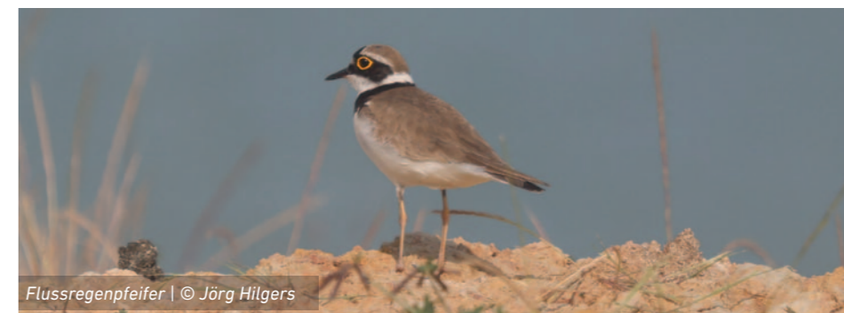
Flussregenpfeifer