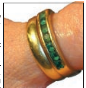
Geschliffener Smaragd aus Kolumbien

Beryllium Be – (chem.) Erdalkalielelement, 2-wertig, Atomgewicht 9,01, Schmelzpunkt 1284°C. Kommt in der Natur vor allem im Beryll vor. Daraus wird Berylliumoxid \text{BeO}