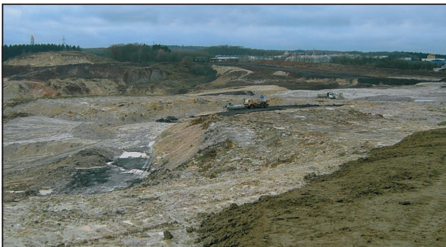
Innenkippe in Westerwälder Tongrube

Berggarten – (bergm.) 1. Belehnung und Untertagetongrube in Siershahn, früherer Betreiber war die Fa. Gewerkschaft Keramchemie-Berggarten (detailliert beschrieben in: Baaden, F. & Schughart, H.W. (1986) Geschichte der Gemeinde Siershahn).